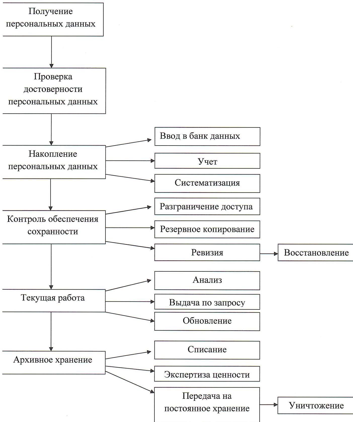
Рис. Порядок обращения с персональными данными работников.